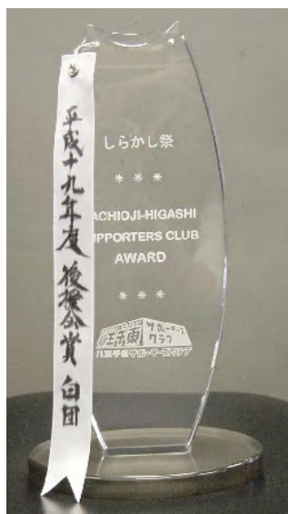
八王子東サポーターズクラブ ロゴ入り後援会賞トロフィー